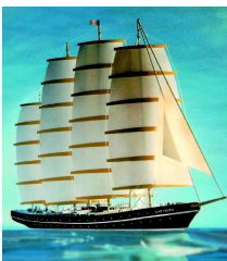
CAPE HORN, 2010 ???

Heinz Otto, Lawaetzweg 3, 22767 Hamburg ; T: 0177-582 98 04 ; F: 040-3861 8701 ; h.otto@windstammtisch.de