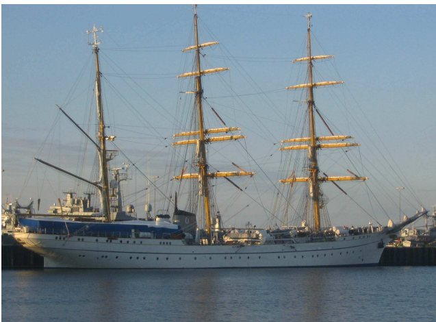
20.06.2008, 20.38 Uhr. "50"-Geburtstag